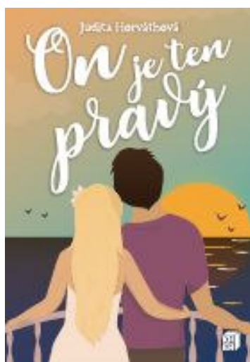
Obálka knihy On je ten pravý