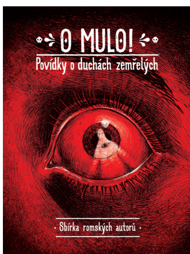
Obálka knihy O mulo!