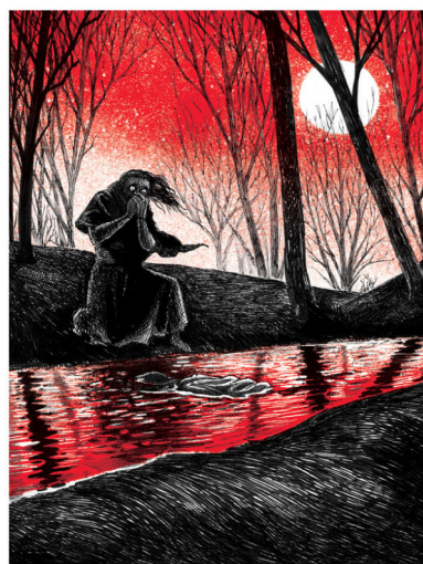
Ilustrace k povídce Ilony Ferkové Živý, nebo mrtvý