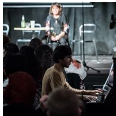
Literární happening – maraton autorského čtení a křest knihy O mulo! (Praha, 2019)